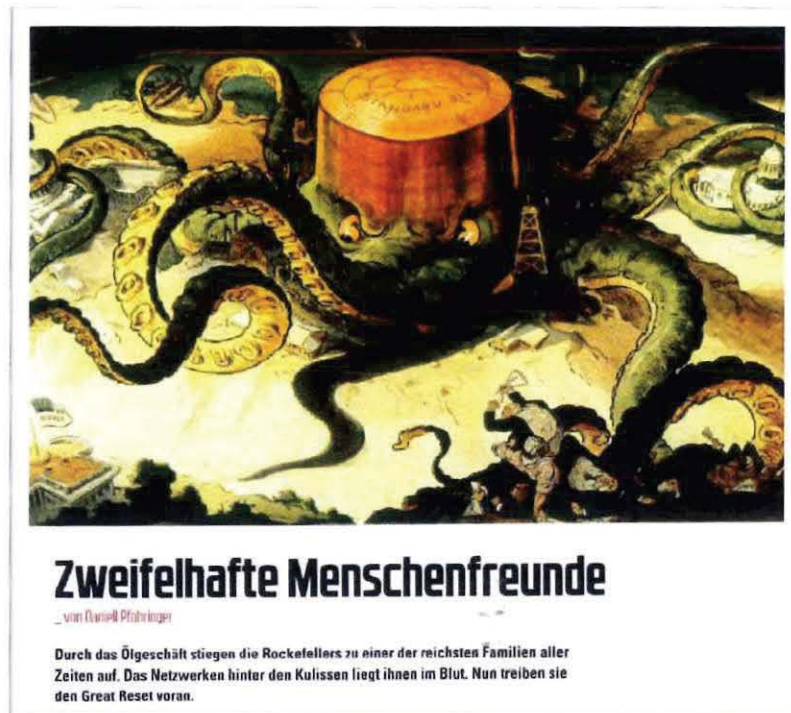
Abbildung 14 Abbildung in COMPACT Spezial Nr. 30