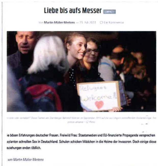
Abbildung 9 Online-Artikel vom 25.07.2023

schnellen Sex in Deutschland. Schulen schicken Mädchen in die Heime der Invasoren. Doch einige dieser Beziehungen enden tödlich.“