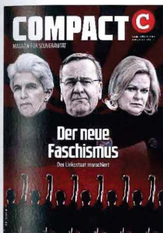
Abbildung 36 Cover COMPACT 3/24