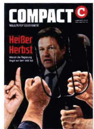
Abbildung 32 Cover COMPACT 9/22