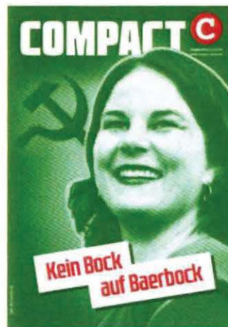
Abbildung 28 Cover COMPACT 6/21