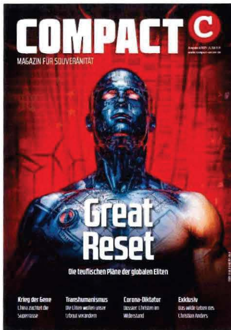
Abbildung 18 Cover COMPACT 4-21

Auch in weiteren Veröffentlichungen wird behauptet, dass ein „Great Reset“ stattfinden und auf das WEF und Klaus Schwab verwiesen: