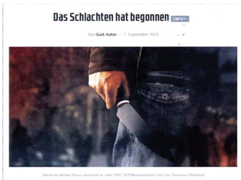
Abbildung 1 Online-Artikel vom 07.09.2023

„Ein Bürgerkrieg ist im Gange, ohne dass die Medien darüber berichten: Junge deutsche Männer werden von moslemischen Gleichaltrigen in immer größerer Zahl überfallen und ermordet.“