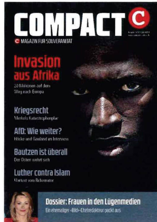
Abbildung 5 Cover COMPACT 10-2016

„Die Flüchtlingskrise von 2015 darf sich nicht wiederholen. Doch die Realität sieht anders aus: Der Asyl-Tsunami wiederholt sich gerade – und könnte in diesem Jahr sogar noch drastischer ausfallen.“