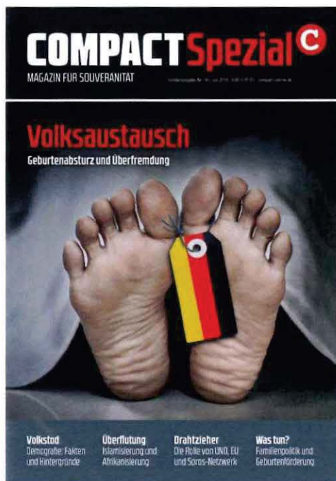
Abbildung 2 Cover COMPACT Spezial Nr. 18

die strukturelle Substitution der „autochthonen“ Bevölkerung durch Zuwanderer aus Afrika sowie dem Nahen und Mittleren Osten. Das Narrativ beruht auf der völkisch-ethnischen Vorstellung eines ethnisch homogenen deutschen Volkes. An die Stelle des ethnisch deutsch verstandenen Volks treten durch „Vermischung“ oder „Austausch“ Menschen anderer Ethnien, mit der Konsequenz, dass das ethnisch deutsche Volk in seiner Existenz untergeht. Innerhalb der Neuen Rechten wird diese Erzählung regelmäßig bewusst als ein von staatlichen Institutionen oder „Eliten“ gesteuerter Prozess bzw. Plan dargestellt. In der Konsequenz werden Menschen mit Migrationshintergrund pauschal als Invasoren und als Gefahr für die ethnisch deutsche Bevölkerung dargestellt und hierdurch herabgewürdigt.