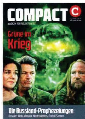
Abbildung 30 Cover COMPACT 6/22