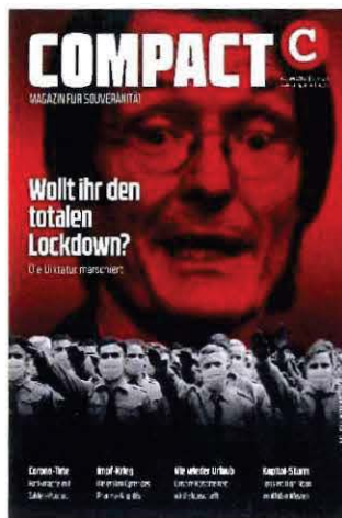
Abbildung 27 Cover COMPACT 2/21