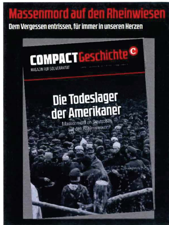
Abbildung 20 Werbeanzeige für COMPACT Geschichte Nr. 17 Abbildung 21 Werbeanzeige für COMPACT Geschichte Nr. 20

Auch mit Artikeln zur Waffen-SS oder der Leibstandarte verbreitet „COMPACT“ NS-relativierende und geschichtsrevisionistische Inhalte. So werden mittels einzelnen Zeitzeugenberichten die Taten der Waffen-SS oder Leibstandarte relativiert oder verherrlicht. Angehörige der Waffen-SS werden beispielsweise als die „ Tapfersten der Tapferen “ oder „ Tapfere Soldaten, keine Verbrecher “ bezeichnet.