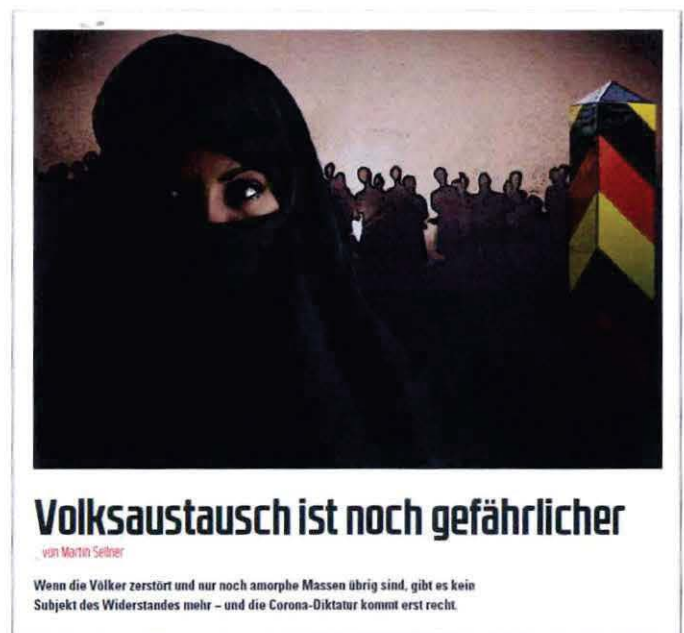
Abbildung 3 Bild + Überschrift Artikel COMPACT 7-2022

„Einig sind sich alle Formationen in der Politik des Great Reset: Volksaustausch durch Masseneinwanderung, [...]“