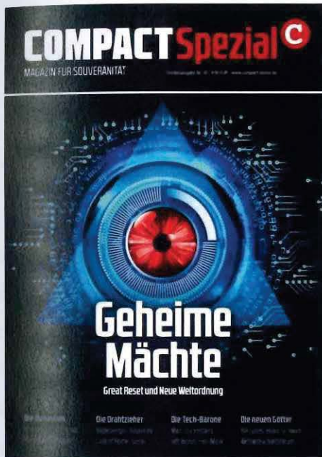
Abbildung 16 Cover COMPACT Spezial Nr. 30

Ursprünglich stammt die Formulierung „Great Reset“ von einer Initiative des Weltwirtschaftsforums WEF, ökonomische Reformen für mehr Nachhaltigkeit und soziale Partizipation durchzuführen. Das WEF und dessen Vorsitzender Klaus Schwab werden daher als antisemitische Chiffren genutzt. „COMPACT“ stellt das antisemitische Verschwörungsnarrativ in den Fokus von zwei veröffentlichten Sonderheften, „COMPACT Spezial“ Nr. 30 „Geheime Mächte. Great Reset und Neue Weltordnung“ und „COMPACT Spezial“ Nr. 32 „Das große Erwachen. Der spirituelle Kampf gegen den Great Reset“ sowie dem Monatsmagazin „COMPACT“ Nr. 4 mit dem Titel „Great Reset – Die teuflischen Pläne der globalen Elite“.