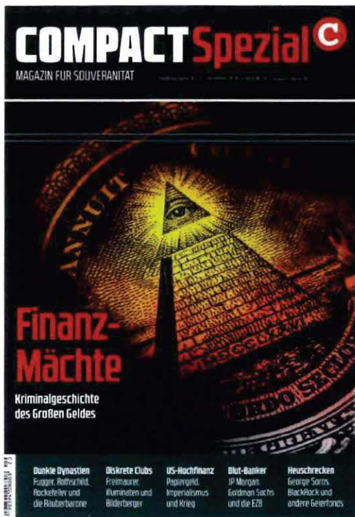
Abbildung 13 Cover COMPACT Spezial Nr. 20

„Der amerikanische Präsident Woodrow Wilson sicherte sich seine Wiederwahl 1916 mit dem Slogan: ‚Er hat uns aus dem Krieg herausgehalten‘. Eine glatte Lüge – denn die US-Hochfinanz hatte Deutschland längst ins Visier genommen.“