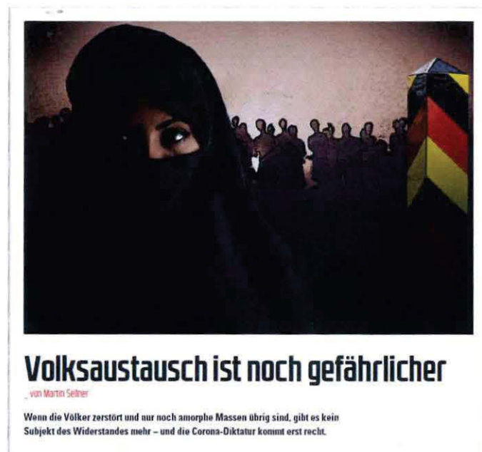
Abbildung 3 Bild + Überschrift Artikel COMPACT 7-2022

„Einig sind sich alle Formationen in der Politik des Great Reset: Volksaustausch durch Masseneinwanderung, [...]“