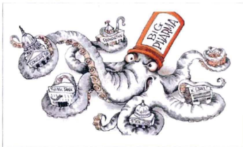
Abbildung 15 Abbildung in COMPACT Spezial Nr. 30