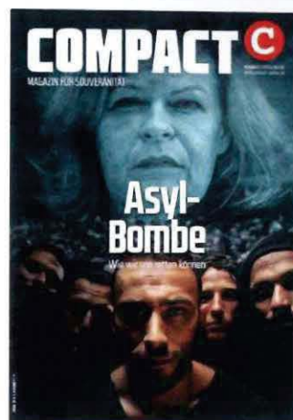
Abbildung 35 Cover COMPACT 11/23