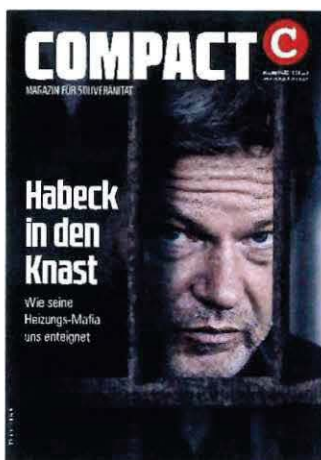
Abbildung 345 Cover COMPACT 6/23