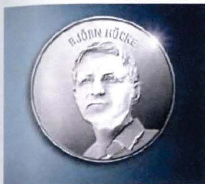
Abbildung 22 Höcke-Taler

Insbesondere der Rechtsextremist Björn Höcke wird von „COMPACT“ als großer Hoffnungsträger propagiert. So ist etwa eine Silbermedaille mit Höckes Konterfei im „COMPACT“-Shop erhältlich. Diese wird wie folgt beworben: