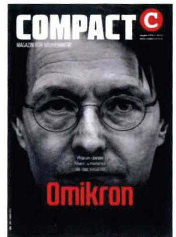
Abbildung 29 Cover COMPACT 2/22