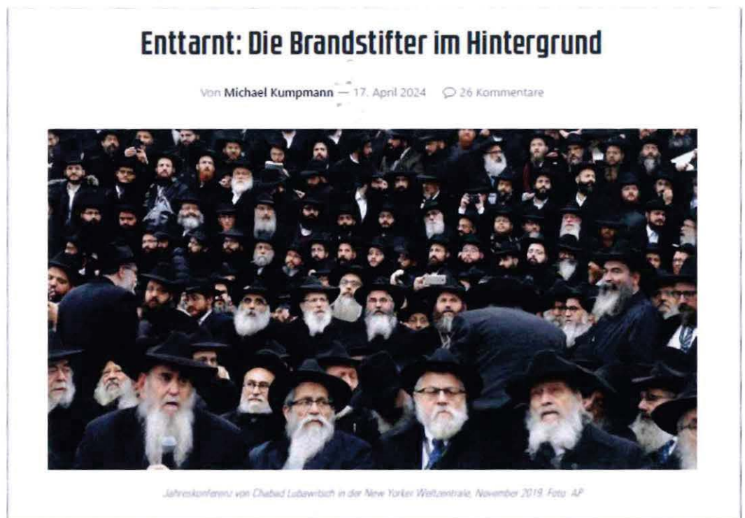
Abbildung 41 Screenshot COMPACT-Online

In einem Online-Artikel vom 17. April 2024 verbreitet „COMPACT“ das Narrativ, die jüdische Gemeinschaft Chabad Lubawitsch arbeite im Hintergrund auf beiden Seiten des russischen Angriffskrieges in der Ukraine an einer Eskalation des militärischen Konflikts.