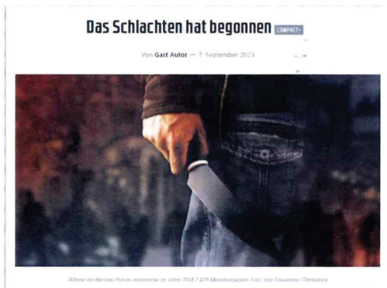
Abbildung 1 Online-Artikel vom 07.09.2023

„Ein Bürgerkrieg ist im Gange, ohne dass die Medien darüber berichten: Junge deutsche Männer werden von moslemischen Gleichaltrigen in immer größerer Zahl überfallen und ermordet.“