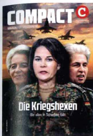
Abbildung 33 Cover COMPACT 3/23

Unterlagen nach § 8a Abs. 1 und/oder 2 BVerfSchG G10