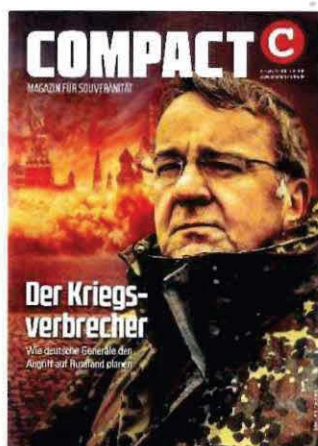
Abbildung 37 Cover COMPACT 4/24