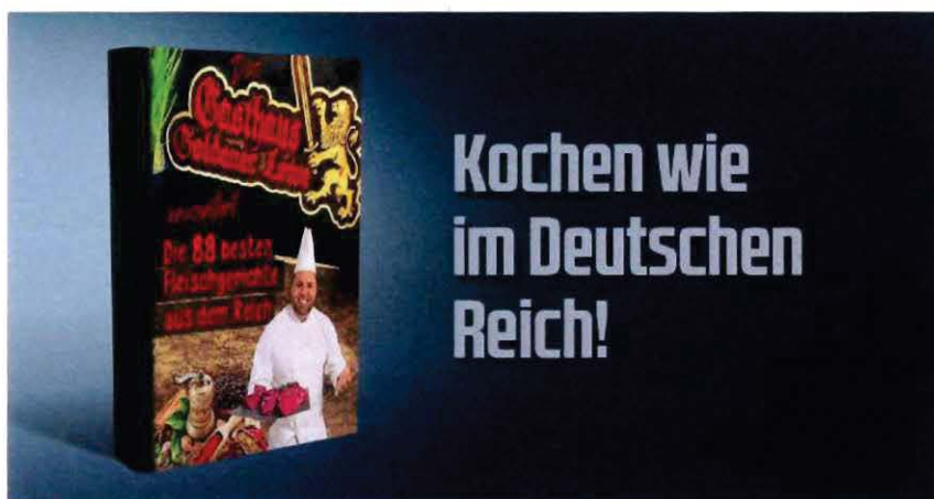
Abbildung 26 Werbebanner auf COMPACT-Online

„COMPACT“ vertreibt und bewirbt des Weiteren das Kochbuch „Die 88 besten Fleischgerichte aus dem Reich“ des Rechtsextremisten Tommy Frenck. Das Buch wird seitens „COMPACT“ als „Kult-Kochbuch“ bezeichnet. Auch wenn das Buch lediglich Kochrezepte beinhaltet, zeigt der Titel gleichwohl die rechtsextremistische Gesinnung, die hinter der Publikation steht. Der rechtsextremistische Code „88“, ersetzt den 8. Buchstaben im Alphabet, sprich HH, und steht für die verbotene Parole „Heil Hitler“. 26