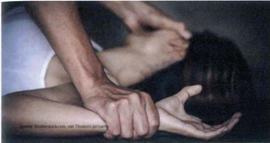
Enthemmte Gewalt gegen Frauen hat seit der Grenzöffnung 2015/2016 epidemische Ausmaße angenommen. Symbolbild Vergewaltigung.