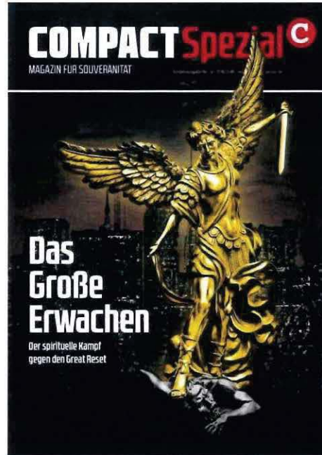
Abbildung 17 Cover COMPACT Spezial Nr. 32