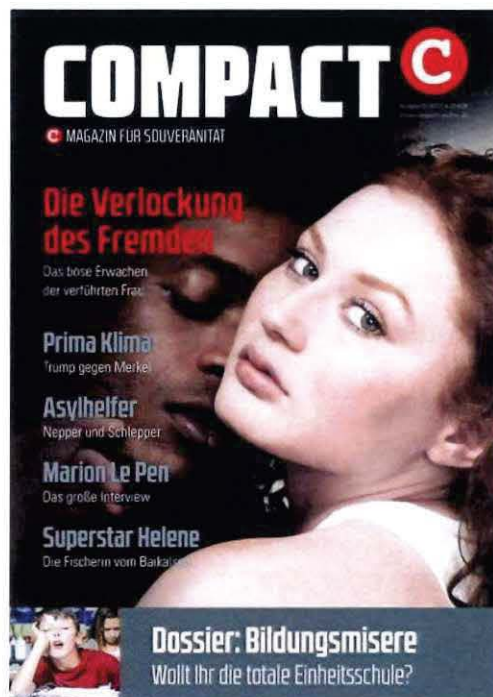
Abbildung 8 COMPACT 07-2017

In einem auf „COMPACT-Online“ im Juli 2023 erneut veröffentlichten Artikel heißt es in der Artikelüberschrift: