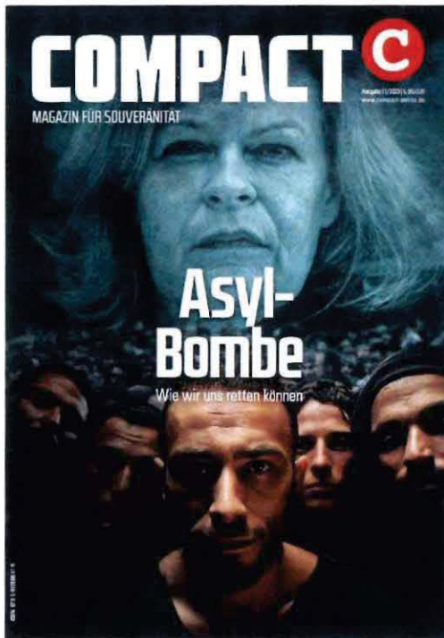
Abbildung 4 Cover COMPACT 11-2023