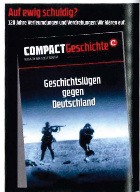
Abbildung 19 Werbeanzeige für COMPACT Geschichte 13

Auch in den Ausgaben „COMPACT Geschichte“ Nr. 13 mit dem Titel: „Geschichtslügen gegen Deutschland“, Nr. 17 mit dem Titel: „Polens verschwiegene Schuld. Verbrechen an Deutschen von Versailles bis zur Vertreibung“ und Nr. 20 mit dem Titel: „Die Todeslager der Amerikaner. Massenmord an Deutschen auf den Rheinwiesen“ verbreitet „COMPACT“ ein revisionistisches Bild. Die beispiellosen Verbrechen des NS-Regimes werden von „COMPACT“ relativiert, indem Verbrechen anderer Staaten angeführt und gleichgestellt werden.