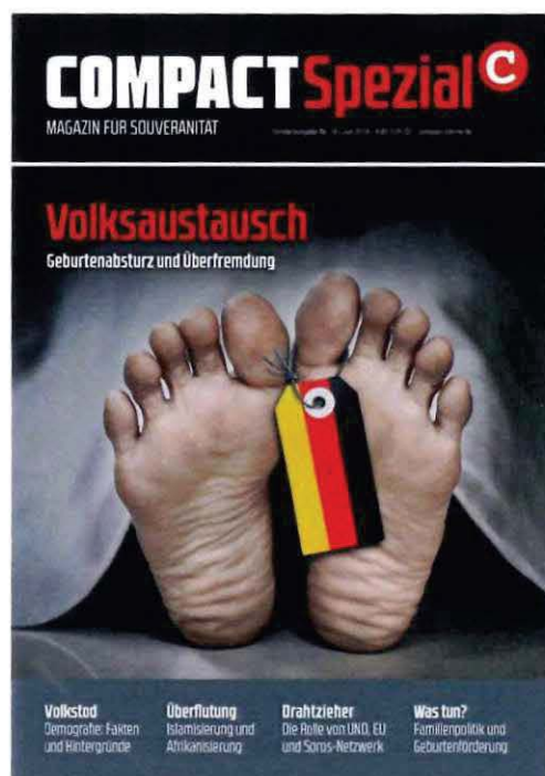
Abbildung 2 Cover COMPACT Spezial Nr. 18

die strukturelle Substitution der „autochthonen“ Bevölkerung durch Zuwanderer aus Afrika sowie dem Nahen und Mittleren Osten. Das Narrativ beruht auf der völkisch-ethnischen Vorstellung eines ethnisch homogenen deutschen Volkes. An die Stelle des ethnisch deutsch verstandenen Volks treten durch „Vermischung“ oder „Austausch“ Menschen anderer Ethnien, mit der Konsequenz, dass das ethnisch deutsche Volk in seiner Existenz untergeht. Innerhalb der Neuen Rechten wird diese Erzählung regelmäßig bewusst als ein von staatlichen Institutionen oder „Eliten“ gesteuerter Prozess bzw. Plan dargestellt. In der Konsequenz werden Menschen mit Migrationshintergrund pauschal als Invasoren und als Gefahr für die ethnisch deutsche Bevölkerung dargestellt und hierdurch herabgewürdigt.