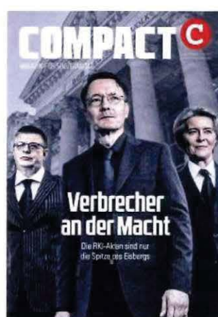
Abbildung 38 Cover COMPACT 5/24

Die daraus und aus den im Kapitel III. A 1. dargelegten Inhalten erwachsende Delegitimierung des demokratischen Systems wird mit verschwörungstheoretischen Narrativen in einen direkten Sachzusammenhang einer „Umvolkung“ und eines „Bevölkerungsaustausches“ gebracht. Ebenso verhält es sich mit den durch „COMPACT“ verbreiteten und ebenfalls im Kapitel III. A 1. aufgezeigten Positionen gegen insbesondere arabischstämmige Menschen, Migranten, „Fremde“ oder Juden. Die hiervon ausgehende Gefahr ist mit Blick auf die zahlreichen diffamierten Personen und Personengruppen, die fortlaufend dieser Agitation ausgesetzt sind, und die daraus