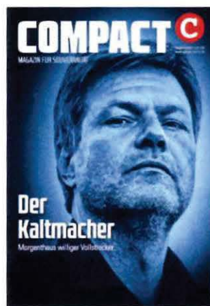
Abbildung 31 Cover COMPACT 8/22